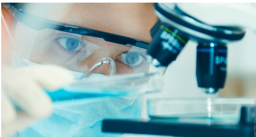
Bild 1: Der dgpzm-elmex® Wissenschaftsfonds stellt Mittel für Forschungsprojekte aus der Präventivzahnmedizin zur Verfügung.

Die Förderung richtet sich an Wissenschaftlerinnen und Wissenschaftler, die sich in ihren Arbeiten mit Themen aus im Bereich der zahnärztlichen Prävention beschäftigen. Ziel des dgpzm-elmex®-Wissenschaftsfonds ist es, wissenschaftliche Projekte im Sinne einer Anschubfinanzierung oder Nachwuchsförderung zu unterstützen. Informationen zur Antragstellung finden Sie auf der Homepage der DGPZM unter http://www.dgpzm.de/zahnaerzte/foerderung-und-preise/forschungsfoerderung . Der Einsendeschluss ist der 31. Mai 2022.